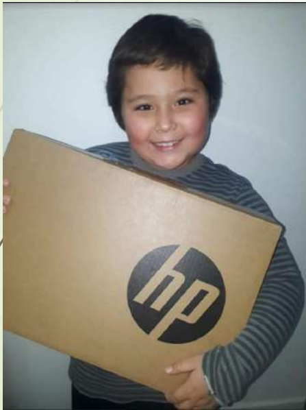
Amaro San Martín 1° Básico A